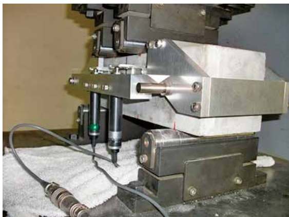
曲げタフネス試験